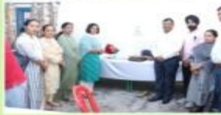
ਖ਼ੂਨਦਾਨ ਲੋਕਵੰਦਾਂ ਦੀ ਜ਼ਿੰਦਗੀ ਬਚਾਉਣ 'ਚ, ਸਹਾਈ ਹੁੰਦੇ-- ਘਟਾਸ਼ਿਅਮ ਕਾਂਸਲ