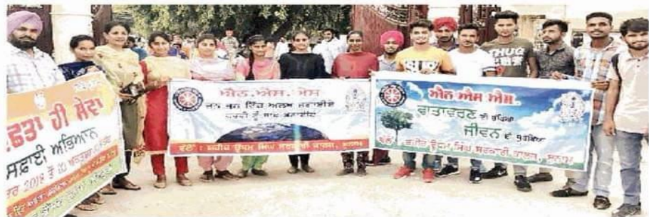
सुनाम के एसएसएस स्कूल में एनएसएस वालंटियर स्वच्छता का संदेश देते हुए