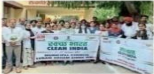
सुनसरी में स्वच्छ भारत रैली में उपस्थित छात्र व अन्य।

सुनसरी नगर नगरपालिकाको दायरामा लैनी रडको नयाँ बस नली बँधी नगरसुधारा रैलीको आयोजना गरिएको छ। यस रैलीमा सुनसरी जिल्लाको विभिन्न विद्यालयका विद्यार्थीहरूको सहभागिता रहेको थियो। रैलीको अवसरमा 'स्वच्छ भारत स्वच्छ भारत'को नारा लगाइएको थियो। रैलीको अवसरमा सुनसरी नगरपालिकाका प्रमुख अधिकारीहरूले विद्यार्थीहरूलाई स्वच्छताको महत्त्वबारे जानकारी गराएका थिए। रैलीको अन्तिम प्ढाँचामा सुनसरी नगरपालिकाको कार्यालयमा पुगी कार्यक्रम समाप्त भएको थियो।