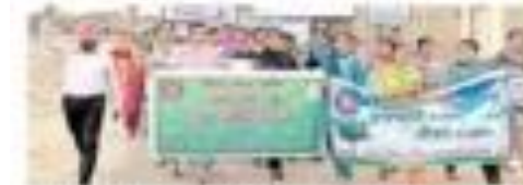
एन.एस.एस. वालंटियर्स ने 28 जुलाई को एक रैली के माध्यम से पानी बचाने का संदेश दिया।

रैली के दौरान छात्रों ने पानी बचाने के लिए कई पोस्टर और बैनर दिखाए। रैली के अंत में, छात्रों ने एक संदेश पत्र को प्रमुख अधिकारी को सौंपा।