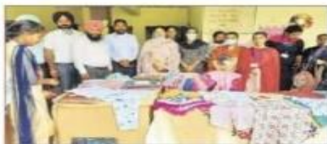
ਸ਼ਿਕਾਰਾ ਮੋਲੀ 'ਚ ਸਾਰੇ ਸਿੱਖ ਸਟਾਲ ਚਾ ਕ੍ਰਿਯ।