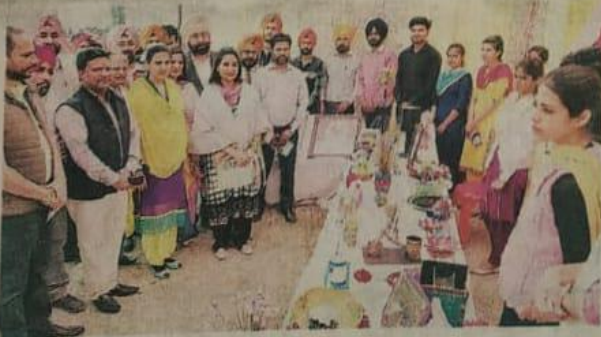
रोजगार मेले के दौरान प्रदर्शनी का जायजा लेती कांग्रेस की हलका इंचार्ज बाजवा