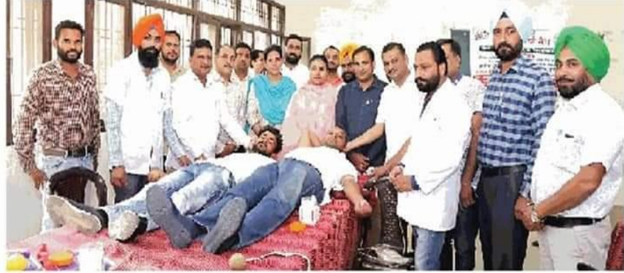
सुनाम में जिला इंडस्ट्री चेंबर द्वारा लगाए रक्तदान कैंप में रक्तदान करते सदस्य