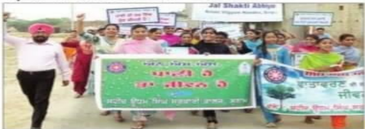
रैली में भाग लेते विद्यार्थी व अन्य।