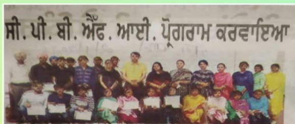
ਜੋਤੁ ਵਿਦਿਆਰਥੀ ਆਪਣੇ ਸਰਟੀਫਿਕੇਟਾਂ ਦੇ ਨਾਲ ਅਤੇ ਸਮੂਹ ਸਟਾਫ਼। (ਰੋਜ਼ੀ)

A certificate and a prize of ₹ 1000 were also given to the qualified students of CPBFI Batch I under the session 2021-22.