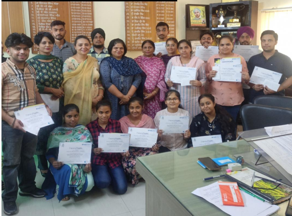
Certificate distribution to CPBFI Batch 1(b) training programme to qualified students

30.121653; 75.806488 SW 39 4RC4+JGX, Bakshiwala, Sunam, Punjab 148028, India