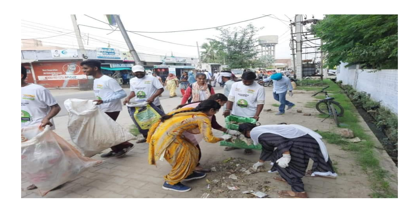
Event: Awareness Rally On Stubble Burning