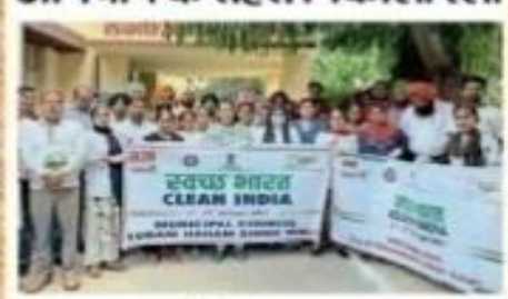
सुराय में स्थानक भारत रेखे में उपस्थित क्राप्ट य अन्य।