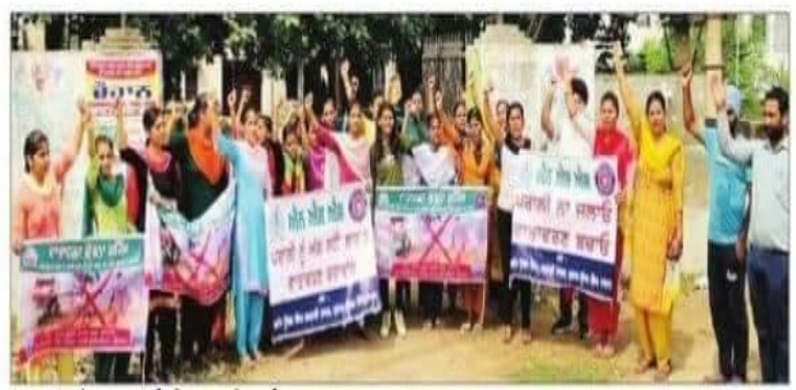
छात्राएं चेतना मार्च निकालती हुईं।

वालंटियर्ज ने इस जागरूकता अभियान में गांव वासियों को घर-घर जाकर बताया कि पराली को आग लगाने से पर्यावरण दूषित होता