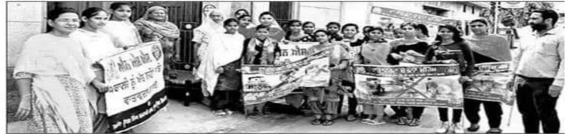
सुनाम के गांव बख्शीवाला में किसान परिवारों को जागरूक करती छात्राएं।