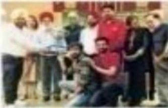
ਵਿਛੇਟਰ ਮੇਂ ਕਲਜ਼ ਸੁਨਾਮ ਦੀ ਹੋਈ ਬੰਨ-ਬੰਨ

ਕੁਲਜ਼ ਸ਼ਰਫਚੀ ਯੂਥਫੈਸਟੀਵਲ ਵਿਛੇਟਰ ਮੇਂ ਕਲਜ਼ ਸੁਨਾਮ ਦੀ ਹੋਈ ਬੰਨ-ਬੰਨ ਅੰਤਰ ਖੇਤਰੀ ਯੁਵਕ ਮੇਲੇ 'ਚ ਸ਼ਰਫਚੀ ਕਲਜ਼ ਸੁਨਾਮ ਦੀ ਹੋਈ ਬੰਨ-ਬੰਨ ਅੰਤਰ ਖੇਤਰੀ ਯੁਵਕ ਮੇਲੇ 'ਚ ਸ਼ਰਫਚੀ ਕਲਜ਼ ਸੁਨਾਮ ਦੀ ਹੋਈ ਬੰਨ-ਬੰਨ