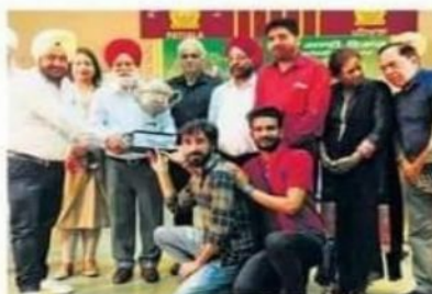
ਕਾਲੇਜ ਦੇ ਛਾਤਰ ਓਵਰਓਲ ਟ੍ਰਾਫੀ ਕੇ ਸਾਖ।