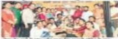
सुनाम में आयोजित हुए चार दिवसीय युवाक मेले में सुनाम के शहीद ऊधम सिंह सरकारी कॉलेज के छात्रों को ओवरऑल ट्रॉफी प्रदान की गई।