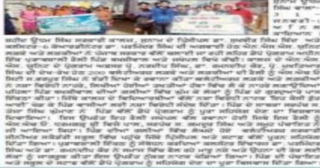
ਡੈਪੋ ਪ੍ਰੋਗਰਾਮ ਲਈ ਰੋਲੀ ਅਤੇ ਨੁੱਕੜ ਨਾਟਕ ਰਾਹੀਂ ਲੋਕਾਂ ਨੂੰ ਜਾਗਰੂਕ ਕੀਤਾ