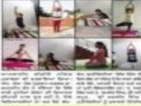
अजमेर विश्व छात्रा के विद्यार्थियों के योग।

बुधवार अजमेर विश्व छात्रा (बुधवार) : अजमेर विश्व छात्रा के विद्यार्थियों ने बुधवार को अजमेर विश्व छात्रा के विद्यार्थियों को योग के माध्यम से स्वास्थ्य को बढ़ावा देने के लिए कहा गया। कार्यक्रम के अंत में, अजमेर विश्व छात्रा के विद्यार्थियों को योग के बारे में अधिक जानकारी देने के लिए कहा गया।