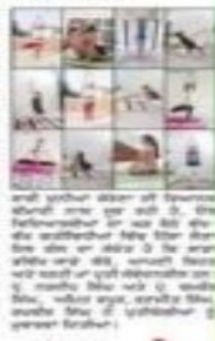
अजमेर विश्व छात्रा के विद्यार्थियों के योग।

बुधवार अजमेर विश्व छात्रा (बुधवार) : अजमेर विश्व छात्रा के विद्यार्थियों ने बुधवार को अजमेर विश्व छात्रा के विद्यार्थियों को योग के माध्यम से स्वास्थ्य को बढ़ावा देने के लिए कहा गया। कार्यक्रम के अंत में, अजमेर विश्व छात्रा के विद्यार्थियों को योग के बारे में अधिक जानकारी देने के लिए कहा गया।