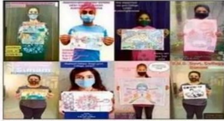
सुनाम लोगों को जागरूक करने के लिए छात्र बनाए पोस्टरों के साथ।

पोस्टर, वीडियो के माध्यम से लोगों को कोरोना प्रति जागरूक कर रहे एन.एन.एस. वालंटियर्स