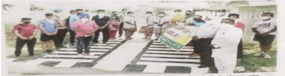
सुनाम के शहीद ऊधम सिंह कॉलेज के एनएसएस यूनिट के कार्यकर्ता लोगों को घर-घर जाकर कोरोना के खिलाफ जागरूक करते हुए